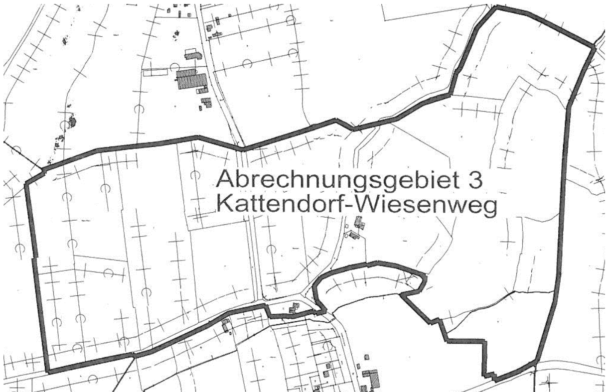
Abrechnungsgebiet 3 Kattendorf-Wiesenweg